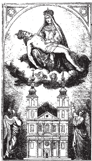
Obraz z osláv tristočinného jubilea milostivej sochy Sedembolestnej (1864). Pri tejto príležitosti dostávali na chráme veže.

Pohromy, vojny a iné nešťastia, ktoré prinášali ľudu veľké utrpenie, znova a znova inšpirovali rozličných umelcov a ich diela dodnes hovoria o ich hlbokej viere a veľkej úcte k Bolestnej Matke. Sú to nielen spomenuté hudobné diela, ale aj piety