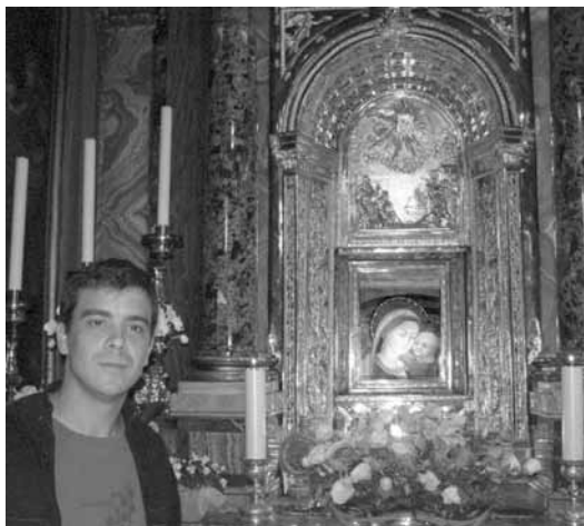
Pri obraze Matky dobrej rady v Genazzane