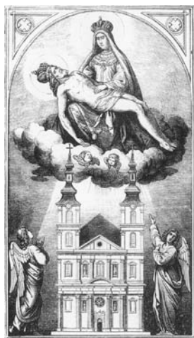
Obraz z osláv tristoročného jubilea milostivej sochy Sedembolestnej (1864)

za duchovnú Matku, keď hovorí Jánovi: Hľa, tvoja matka! V každom našom kríži a trápení sa na ňu môžeme obrátiť a prosiť ju o silu vydržať a prekonať všetky protivenstvá – o silu nevzdať to! A ona nám svoju starostlivosť už toľkokrát dokázala v dejinách nášho národa.